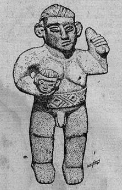
Usedara o sea el sacerdote-sacrificador de víctimas humanas, de los huetares, con la cabeza ya escindida del cuerpo

Lítica Huétar Primeramente, debido a su importancia numérica y a una más extensa ocupación territorial, debemos mencionar a los indios huetares. Este nombre "huetar" es un patronímico, evidentemente de rivado, del cacique Huetar, su cau dillo óponimo. Los Huetares habitaron toda nuestra costa Atlántica, las altiplanicies centrales y los dilatados valles al Sur del lago de Nicaragua y del Río San Juan; además, en la costa del Pacífico dominaban todo el trecho comprendido, aproximadamente, entre el río Aranjuez y la Punta Quepos. Traspasando nuestras fronteras políticas actuales, esta cultura se internaba por la costa de la Mosquitia, en Nicaragua, y al través de la Laguna de Chiriquí, en Panamá, pero en ambos países se le designa con diferentes nombres. Nuestra región huetar estuvo densamente poblada en tiempos prehispánicos; como testimonio de ello tenemos que no existe término mu (Pasa a la Pág. SEIS)