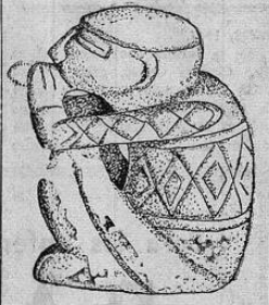
Sukla o sea el médico, sacerdote, hechicero de los huetares, siempre representados en cucullas, aquí aparece fumando ritualmente

samente poblada en tiempos prehispánicos; como testimonio de ello tenemos que no existe término mu (Pasa a la Pág. SEIS)