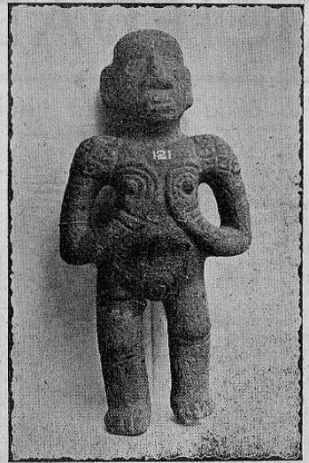
Idolo femenino de pie, cultura huasteca. Colección Museo Nacional

nicipal en Costa Rica, dentro de cuya jurisdicción no se hallen inúmeros yacimientos arqueológicos.